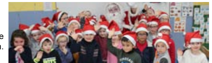
Visite du Père-Noël