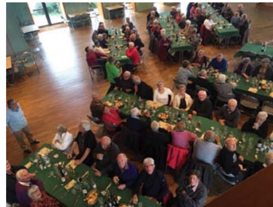
Le repas du CCAS s'est tenu le 27 octobre 2018