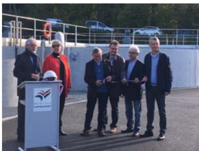
Inauguration de la station d'épuration le vendredi 19 octobre, en présence des partenaires financiers, des élus locaux et des représentants de la conception