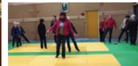
Atelier déquilibre organisé par le dispositif «Vas-y».