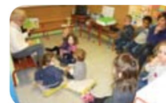
Les histoires contées