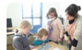
Atelier BD à la médiathèque