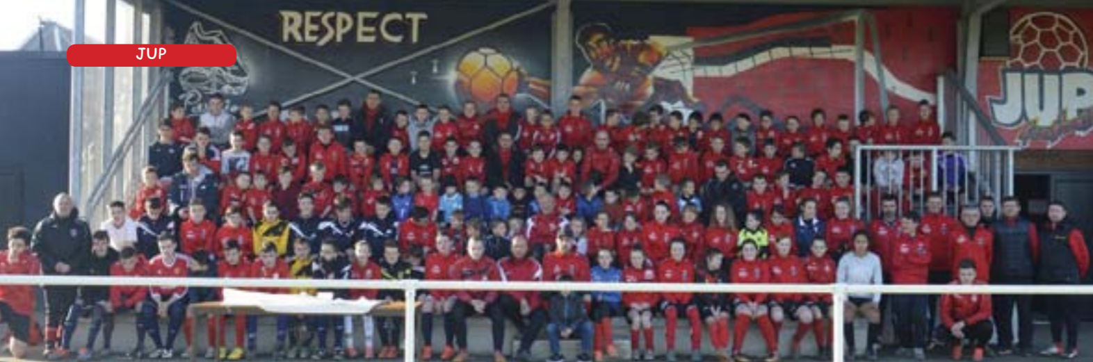
Stage de Noël de l'école de Foot

Plus d'une centaine de jeunes de l'école de foot de la J.U.P. s'est retrouvée au complexe sportif de Kérivoas pour le désormais traditionnel stage de Noël. Les enfants des catégories U6 à U17 ont répondu avec ferveur à cette invitation qui leur a permis de se défouler entre les deux réveillons. L'encadrement a été assuré par les éducateurs bénévoles du club et les parents qui ont servi le repas chaud du midi puis un chocolat, des brioches et la galette des rois.