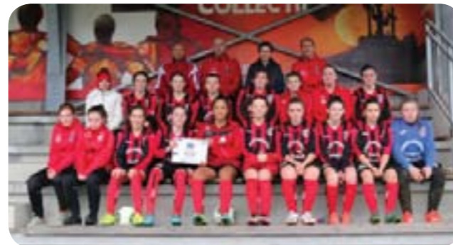
Label de bronze pour l'école de foot féminine de la J.U.P.