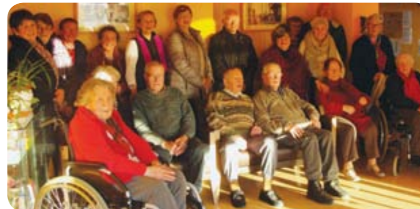
visite des élus de Plougonven à Ker an Dero

Permanences : 1er et 3ème vendredi de chaque mois ( sur rendez-vous) - Mairie Plougonven