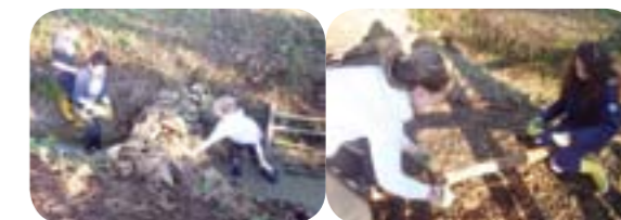
Construction d'une cabane, chemin des fontaines Christ