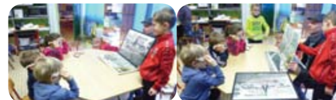
Découverte d'images en 3D