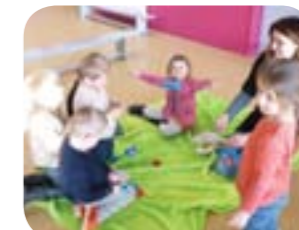
Enfilage de bouchons